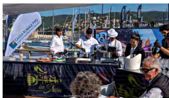
Collaboratori Istituto ISIS S. Pertini – De gusto in Barcolana 55